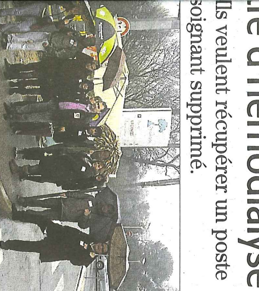
Planifique du Parc, à l'appel de la CGT et FO.

Ils veulent récupérer un poste soignant supprimé.