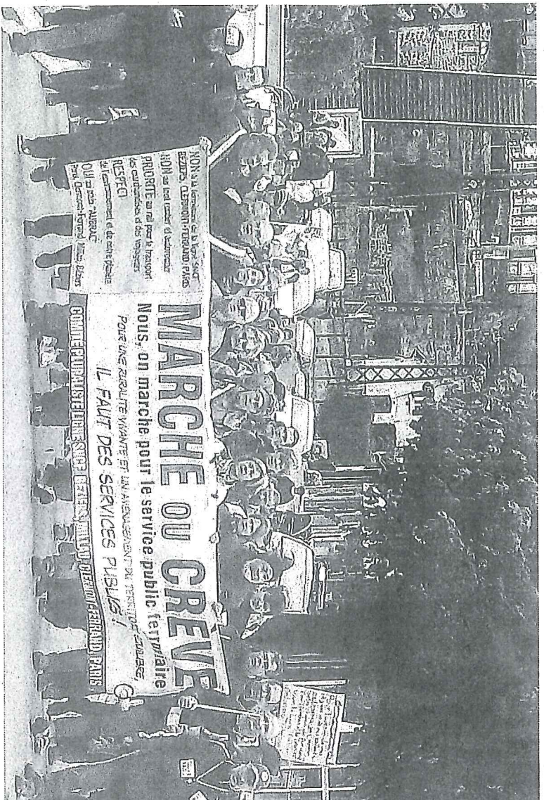
Les défenseurs de la ligne ont parcouru dans la fraîcheur les 7 km entre Talzac et Neussargues.

Rassemblés derrière une banderole « Marche ou crève », les participants avaient quitté la gare de Béziers le 4 mai dernier. Après une vingtaine de kilomètres à pied, traversant les communes desservies par la ligne ferroviaire, ils étaient arrivés en fin de journée à Magalas. Sur le parcours, de nombreuses haltes avait été effectuées. A Béziers par exemple, au niveau du pont SNCF de l'avenue Pierre Villon. Là, ils avaient rejoint le premier adjoint au maire de la ville. Lequel inaugurerait une pancarte demandant la mise en place d'une halte ferroviaire pour desservir les commerces, services administratifs et établissements scolaires de la zone. La troupe d'une grosse cinquantaine de personnes s'était ensuite arrêtée quelques kilomètres plus loin à Boujan-sur-Libron. Pour demander la aussi, avec la municipalité, une halte ferroviaire au niveau du Pont de Monesté. De nombreux élus avaient participé à cette première étape. Les maires de Puissaliçon, Magalas, Puiमित-son, Thézan-les-Béziers étaient présents. On avait pu voir aussi Jean-Claude Gaysot, l'ancien ministre communiste des Transports. Les médias avaient aussi largement relayé l'information. France 3 s'était déplacé pour faire un reportage. Au final, malgré les quelques réactions d'agressivités de nombreux automobilistes, les